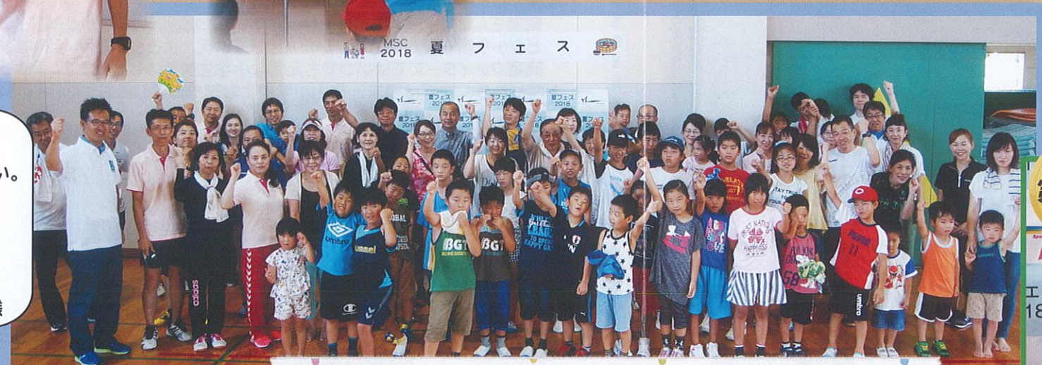
暑い中、たくさんのご参加誠にありがとうございました!

5位から順に表彰され、どんどん大きくなるお菓子の詰め合わせを見て「わあ〜!!」と歓声が上がっていました。他にも運動を頑張った20人にがんばり賞が渡され、みんなとても嬉しそうでした。