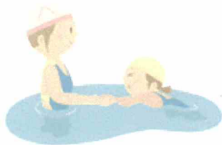
… 1期予定表 (16:50～18:50) …

▼問合せ 東山体育センター TEL80-0195 (豊田市宝来町4-758-10)