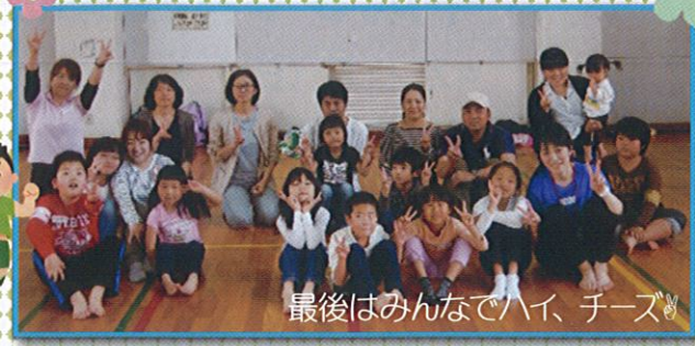
最後はみんなでハイ、チーズ!