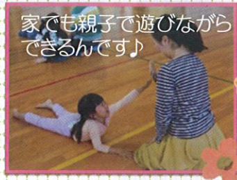
家でも親子で遊びながら できるんです♪