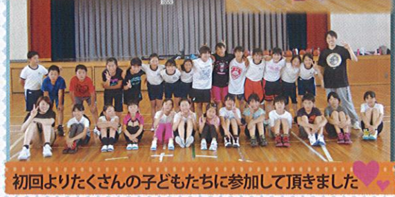
初回よりたくさんのお子様たちに参加して頂きました!