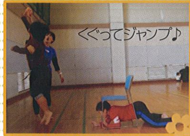
くぐってジャンプ♪